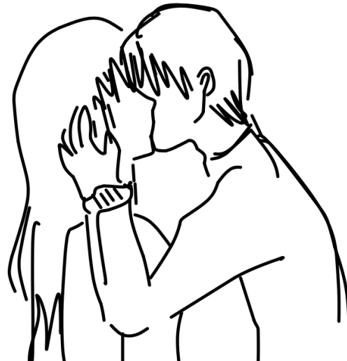
'De kus' van Gustav Klimt 1907